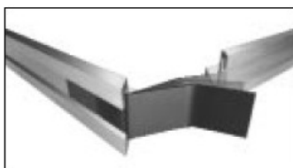
Zatraskowe blokady narożnikowe